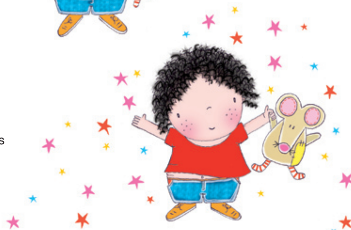
Daar is ie dan!